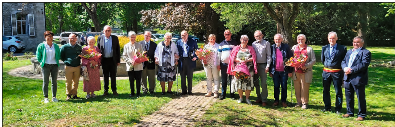
Cérémonie du 4 mai 2022.

Le mariage est une étape importante dans la vie. Lorsqu'il s'inscrit dans la durée, il est gage de réussite ! Lors des cérémonies des 4 mai et 1 er juin derniers, les Autorités communales ont tenu à mettre à l'honneur 12 couples de l'entité. L'un célébrait ses noces de brillant (65 ans) ; cinq, leurs noces de diamant (60 ans) et six, leurs noces d'or (50 ans). Pour un total de 665 ans d'amour !