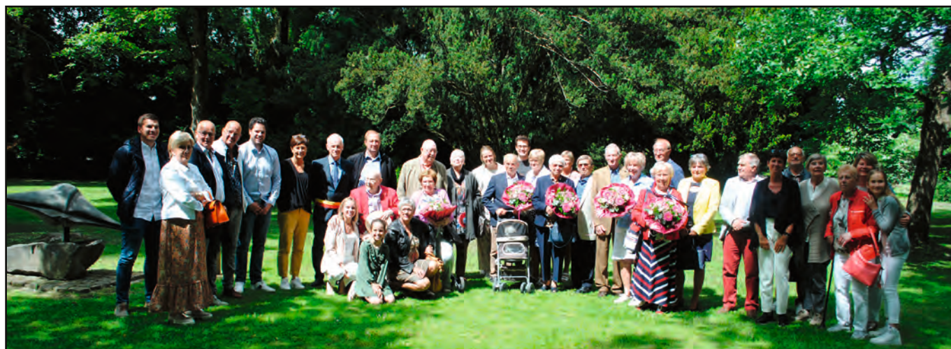
Cérémonie du 1 er juin 2022 (Photo Julien Bil).