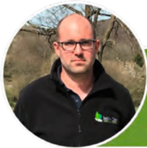
J. Dardenne Jardins Dard & Déco Dard à Villers-Ste-Gertrude

Si, vous aussi, vous pensez que votre activité mérite un petit coup de projecteur, prenez contact avec l'équipe de l'ADL ( adl@durbuy.be ou 086/219.841) qui se fera un plaisir de vous rencontrer.