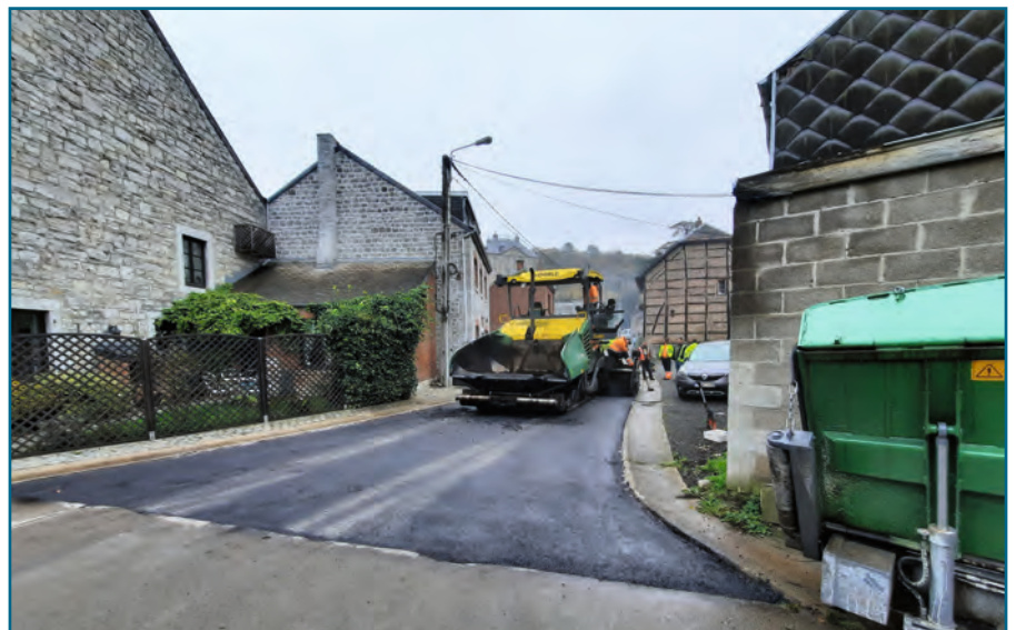
Bomal, rénovation de la rue Vinâme.