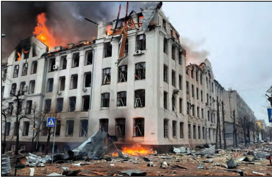
Ukraine. Sous les bombes russes.