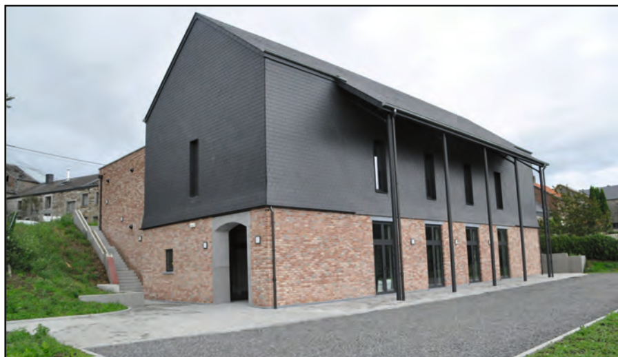
Villers-St-Gertrude, la Maison rurale polyvalente.

Quant à l'asbl « Présence », gestionnaire de l'Espace Saint-Michel, elle retrouve au rez-de-chaussée, une salle d'une superficie de 450 m 2 , afin d'y organiser ses multiples et diverses activités sociales, culturelles et sportives. Cette salle pourra également accueillir les familles du village et des environs qui souhaitent organiser des événements familiaux.