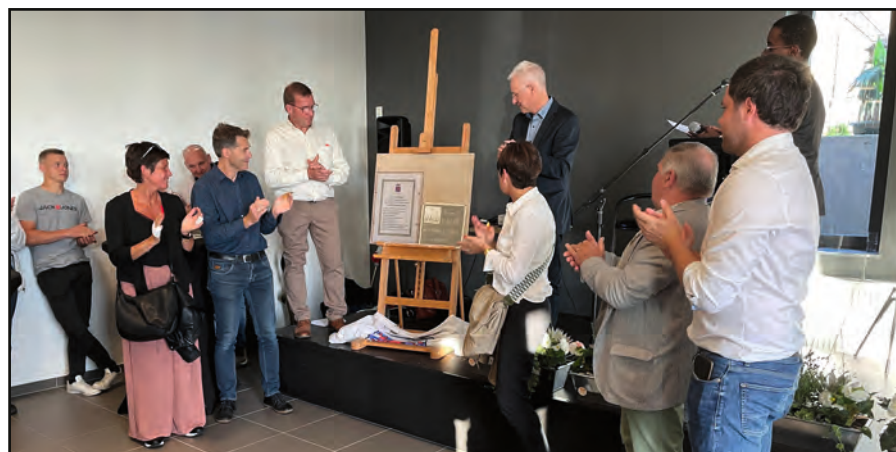
Villers-St-Gertrude, inauguration de l'Espace Saint-Michel.