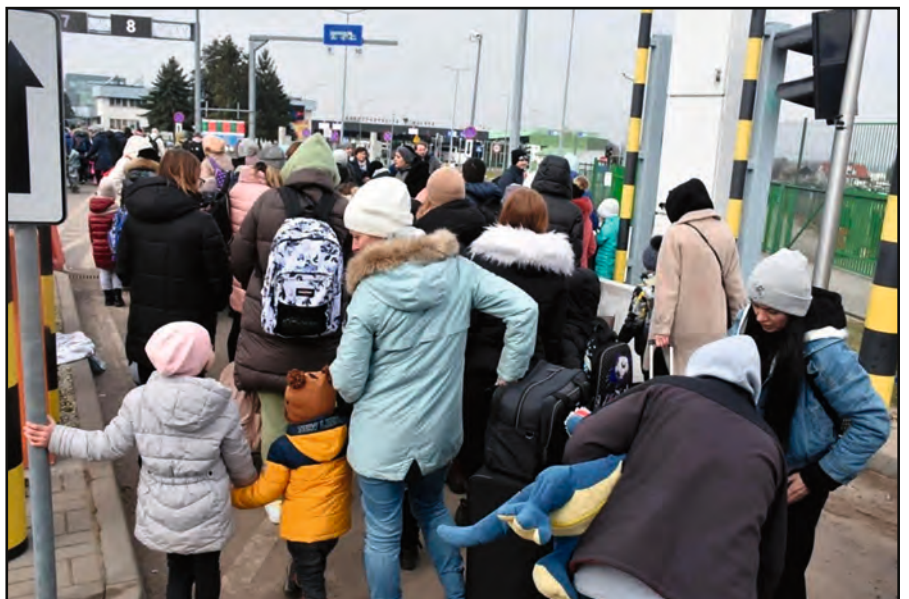
Ukraine. Sur les chemins de l'exil.

Pendant des décennies, on a banni le mot « guerre » du vocabulaire européen. Pendant toutes ces années, on a cru qu'il n'y aurait plus de guerre en Europe, et nous voilà aux prises avec une guerre à l'ancienne, au point que certains politologues se demandent si les Européens ne sont pas en train de recommencer l'erreur des accords de Munich en 1939.